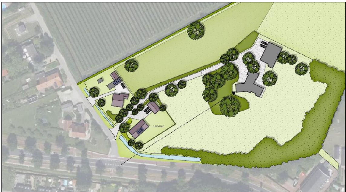
Figuur 1: Schets van de te bouwen woning in het plangebied.

Buro Waalbrug heeft het Natuur-Wetenschappelijk Centrum (NWC) gevraagd om Aerialis-berekeningen uit te voeren voor de voorgenomen plannen en te adviseren omtrent de relevante natuurwetgeving.