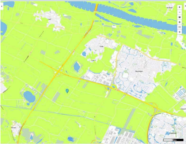
Uitsnede kaart Regels Landbouw Omgevingsverordening Gelderland, geconsolideerde versie 2018

In voorkomend geval zal hier dus ook de handreiking Plussenbeleid Gelderland met daarnaast Beuningse aanvullingen van toepassing zijn.