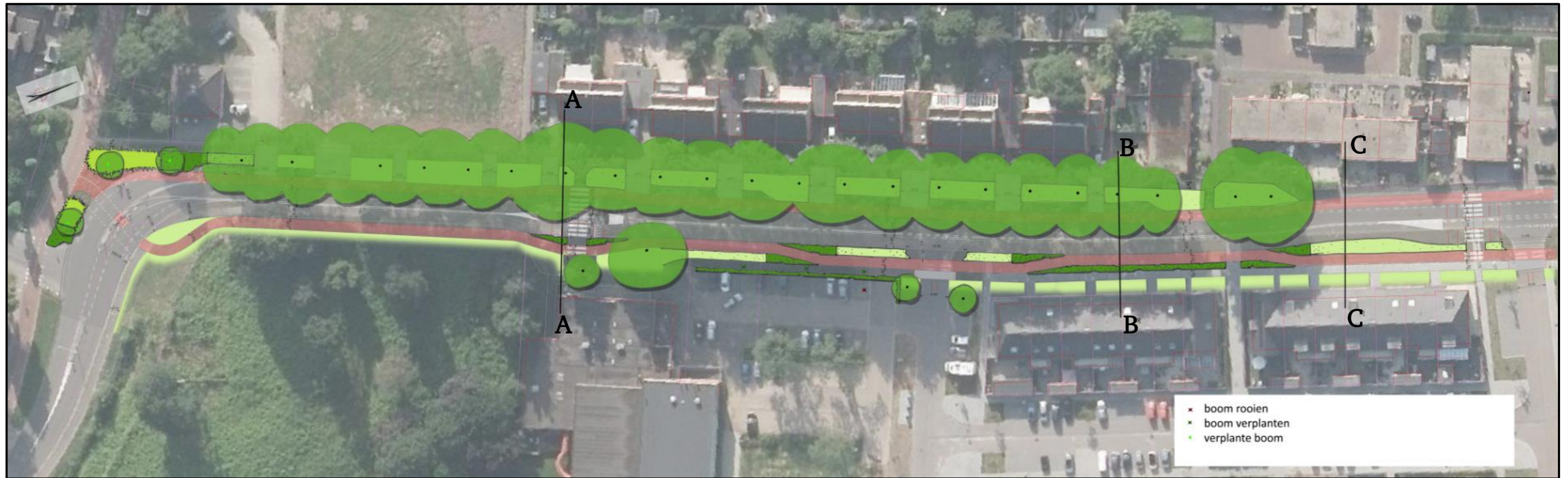
Figuur 1: Bovenaanzicht schetsontwerp herinrichting Houtduiflaan